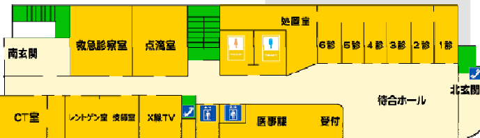
携帯電話使用可能区域